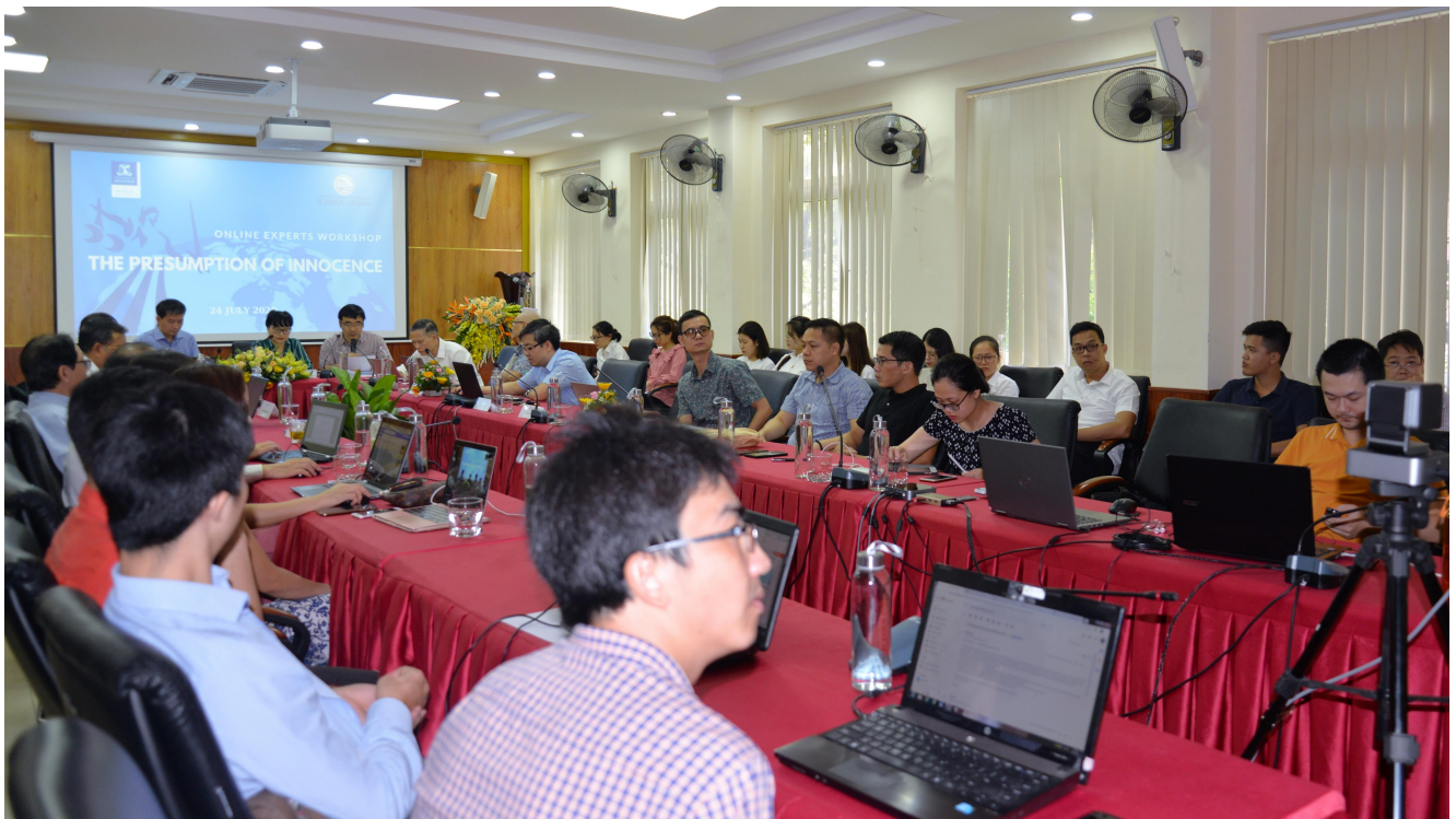
Toàn cảnh Hội thảo tại Khoa Luật, ĐHQGHN

Tiếp nối thành công của các Hội thảo trực tuyến trong thời gian qua, ngày 24/7/2020, Khoa Luật, Đại học Quốc gia Hà Nội (ĐHQGHN) đã tiếp tục tổ chức Hội thảo chuyên gia trực tuyến về nguyên tắc suy đoán vô tội. Hội thảo có sự phối hợp của Trung tâm Nghiên cứu Luật châu Á thuộc Trường Luật Đại học Melbourne (Úc).