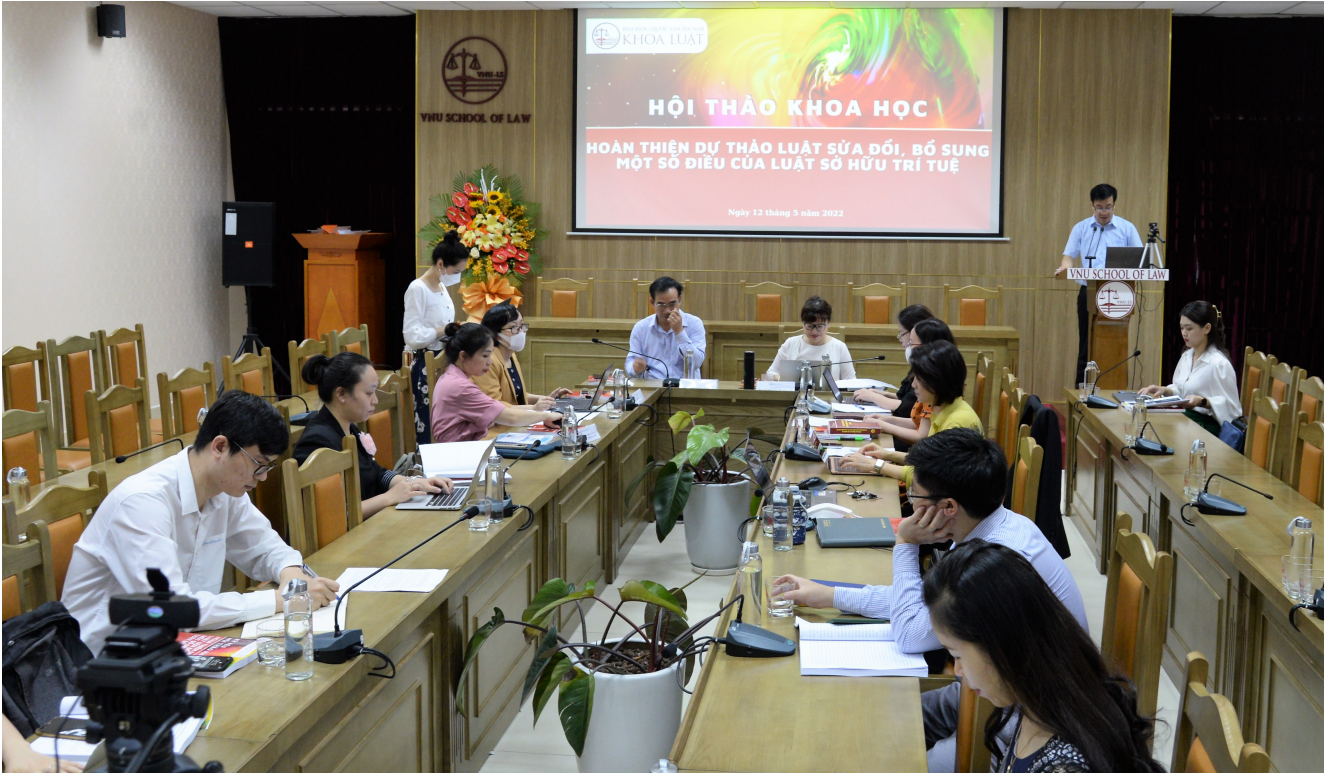
Đại biểu tham dự trực tiếp tại Hội thảo