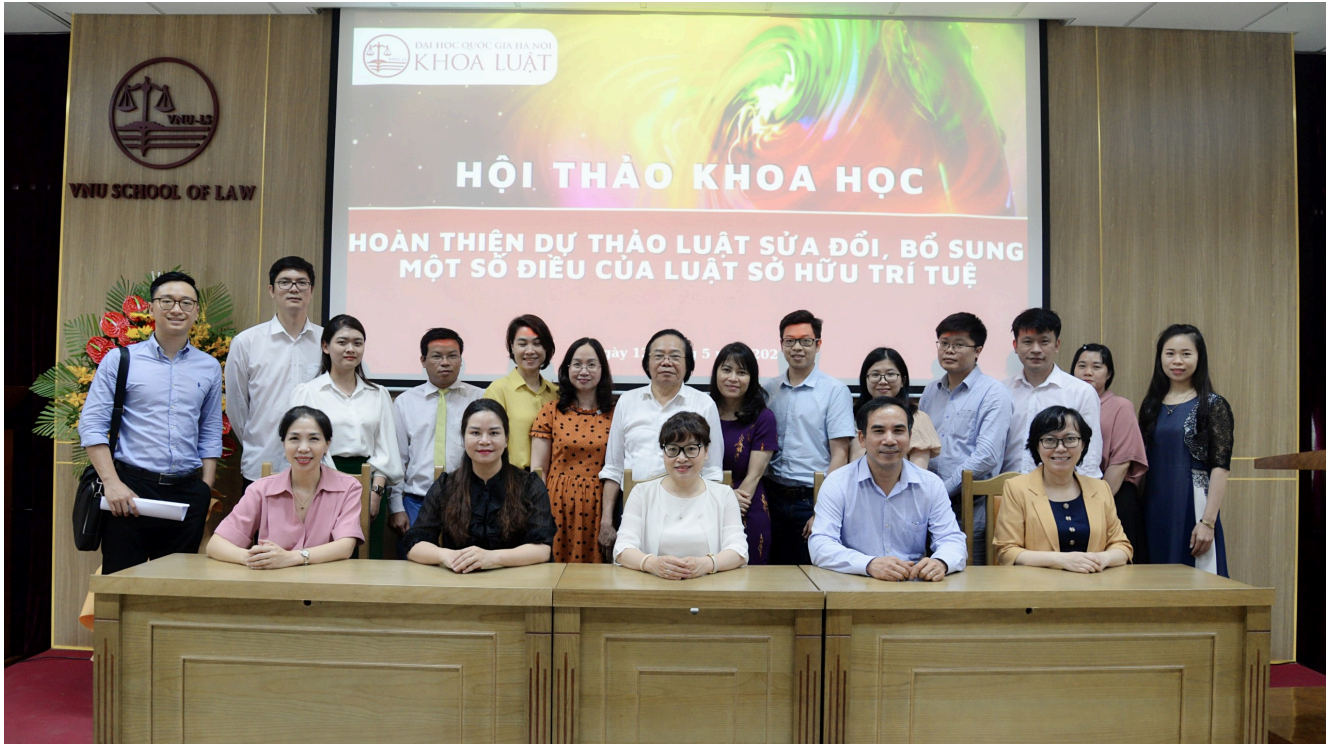
Chụp hình lưu niệm